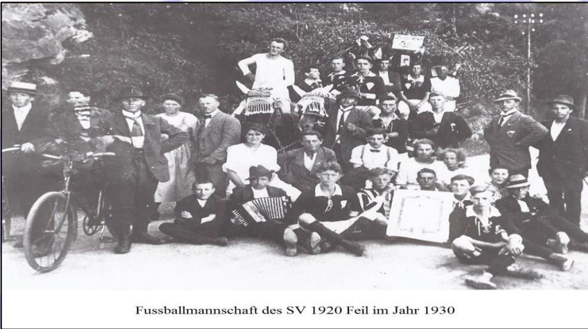
Fussballmannschaft des SV 1920 Feil im Jahr 1930

Anfangs der dreißiger Jahre flackerte die Begeisterung für den Fußballsport in Feilbingert wieder auf. Zum zweiten Male musste das Fußballfeld am Maiwald, das zwischenzeitlich landwirtschaftlich genutzt wurde, durch Eigenleistung der Mitglieder hergerichtet werden. Die Pacht an das Forstamt von 25 Reichsmark bezahlte die Gemeinde, da auch die Schule den Sportplatz benutzte. Der Spielbetrieb war aber auch jetzt noch nicht organisiert und der SV bestritt lediglich Freundschafts- und Pokalspiele. Eine Teilnahme an den Verbandsspielen stand nicht im Programm, sodass viele gute Spieler aus Feilbingert zu den Nachbarvereinen Bavaria Ebernburg und SG Obermoschel abwanderten. Ab 1937 wurde wieder der Verein Pachträger des am Maiwald gelegenen Sportgeländes. Mit dem Ausbruch des 2. Weltkriegs musste der Sportbetrieb des SV abermals eine Zwangspause bis 1945 einlegen. Auch aus den Reihen der Sportkameraden ließen viele in diesem furchtbaren Krieg ihr Leben.