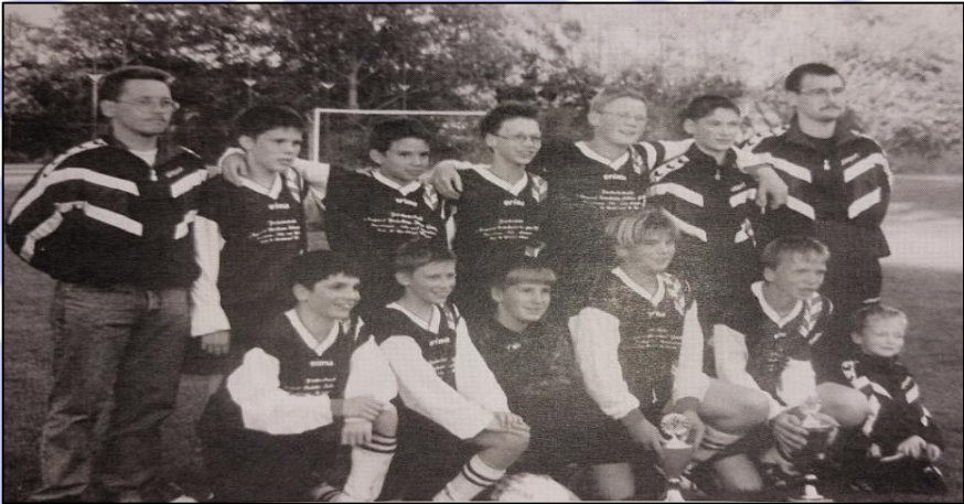
D-Jugend Kreismeister/Pokalsieger/Bezirksmeister 1999

1999 schaffte die Mannschaft dann das seltene Ereignis der Pokal-Titelverteidigung, was aber nicht der wichtigste Titel der D-Jugend in dieser Saison sein sollte, denn obendrein konnten sie durch einen 9:0 Sieg im Entscheidungsspiel gegen den TuS Hargesheim auch den Kreismeistertitel gewinnen und als wäre der Doublegewinn nicht schon Erfolg genug gewannen die erfolgshungrigen Nachwuchsspieler auch noch die Bezirksmeisterschaft und krönten sich dadurch zum ersten und bis heute einzigen Trippel- Gewinner in der 100 jährigen Vereinsgeschichte des SV Feilbingert.