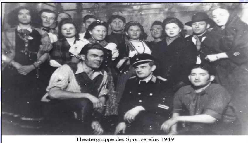
Theatergruppe des Sportvereins 1949

Den kulturellen Beitrag des Laienspiels leistete der Verein durchgehend bis weit in die Jahre nach dem 2. Weltkrieg. Erst unter dem Einfluss von Film und Fernsehen ist dieser schöne Brauch verschwunden.