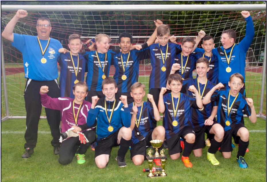
D-Jugend Kreispokalsieger nach einem 2:1 gegen Winterbach.

So wurde man in der Saison 2018/2019 zum zweiten Mal nach 1999 Doublesieger in der D-Jugend und holte nach der Kreismeisterschaft auch den Kreispokal am 14.06.2019 nach Feilbingert.