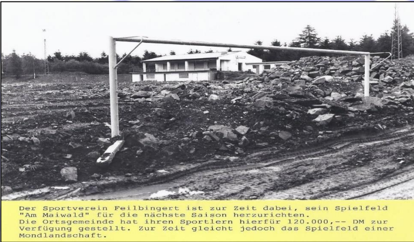
Der Sportverein Feilbingert ist zur Zeit dabei, sein Spielfeld "Am Maiwald" für die nächste Saison herzurichten. Die Ortsgemeinde hat ihren Sportlern hierfür 120.000,-- DM zur Verfügung gestellt. Zur Zeit gleicht jedoch das Spielfeld einer Mondlandschaft.