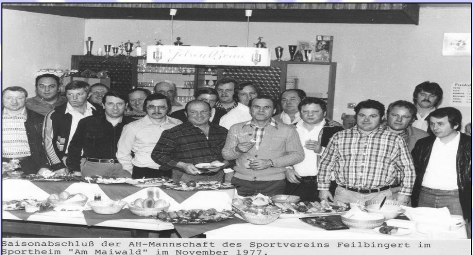
Saisonabschluß der AH-Mannschaft des Sportvereins Feilbingert im Sportheim "Am Maiwald" im November 1977.

Nach der 1970er Generalversammlung wurde umgehend mit dem Bau des Sportheimes begonnen, sodass die Gäste der Jubiläumsfeier zum 50-jährigen Vereinsbestehens, welches vom 01.08.-09.08. des gleichen Jahres am Maiwald gefeiert wurde, das neue Sportheim bereits im Rohbau bestaunen durften. Die Feierlichkeiten zum 50jährigen Vereinsjubiläum wurden mit einer Sportwoche gefeiert und zur akademischen Feier am 1. August 1970 konnte man keinen geringeren als den 54er Fußball-Weltmeister Horst Eckel als Schirmherr gewinnen.