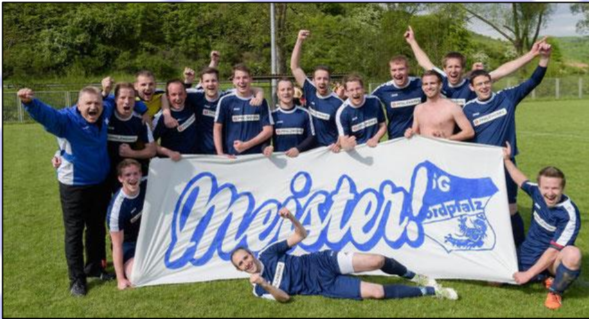
2.Mannschaft Saison 15/16 Meister der C-Klasse

In der Saison 15/16 scheiterte man nur in den Aufstiegsspielen gegen die Mannschaft aus Schmittweiler mit zeitgleicher Meisterschaft der 2.Mannschaft. Im darauffolgenden Jahr konnte man mit großem Vorsprung auf den Tabellenweiten bereits kurz nach Ostern die Rückkehr in die A-Klasse feiern.